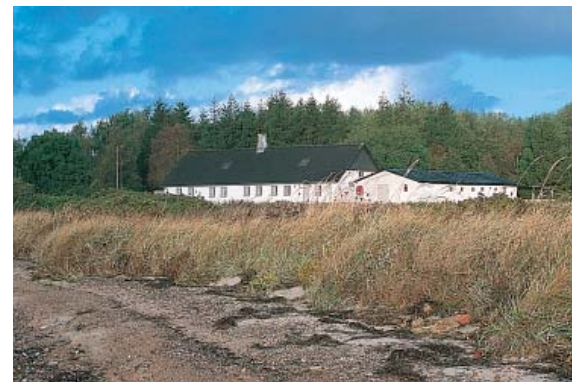
3. Færgegården havde krostue. Færgen forbandt Sillerslevøre med Nymølle i Salling (landingsstedet kan pejles på den gamle teglværksskorsten på fjordens sydside).

De dominerende landskabstræk består af det store, flade område fra Sillerslevøre til Sillerslev Kær og Ørding Kær. Desuden er havskrænten markant, ved havnen er den meget tydelig.