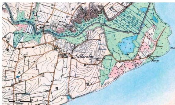
Sillerslev på Generalstabens kort 1882.

Sillerslevs udvikling hænger sammen med fiskeriet. Havnen er derfor vigtig for forståelsen af området. Det er den eneste fiskerihavn uden for Nykøbing, og dens tilblivelse skyldes i høj grad fiskernes stædige kamp op gennem 1950'erne. I dag præges området af de mange sommerhuse ved Sillerslevøre.