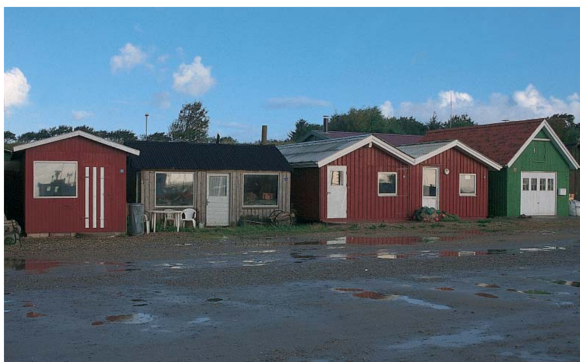
2. Sillerslev Havns bygninger skildrer først og fremmest fiskernes behov. Her er huse og skure i en nyttig blanding. Rækken af farvestrålende skure er typisk for det selvgroede miljø.