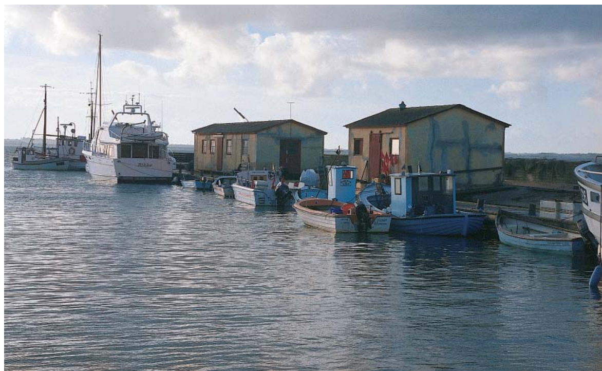
1. På den vestlige havnemole er der boder, hvorfra fiskerne tidligere solgte deres fangster.